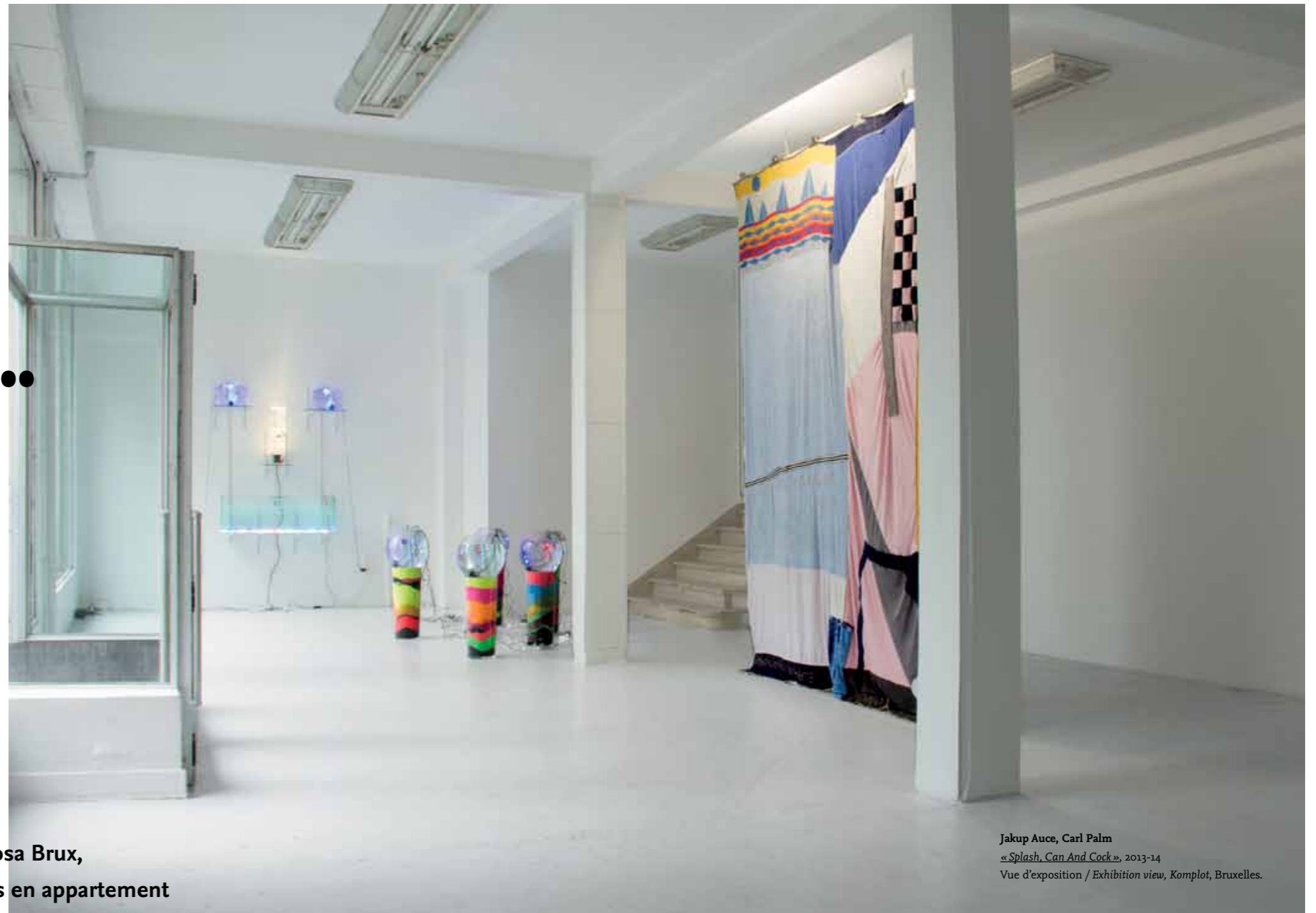
Jakup Auce, Carl Palm « Splash, Can And Cock », 2013-14 Vue d'exposition / Exhibition view, Komplot, Bruxelles.